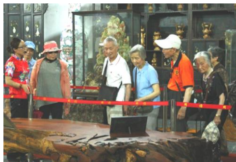
老同志在周园参观游览。

令人欣慰的是，本因失误导致的第一辆车的这个应变却取得了意想不到的效果：坐这辆车的老同志在进餐和游览时都避开了客流高峰，还让有糖尿病的老同志避免了因不能及时进餐可能给身体带来的伤害；坐第二辆车的老同志的周园之旅也很顺利。