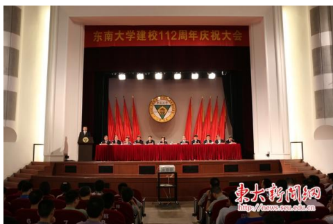
东南大学召开大会隆重庆祝