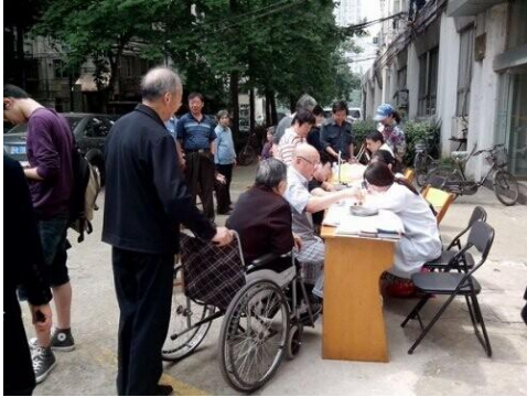
志愿者为残疾人和老人提供健康服务