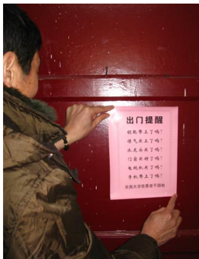
老同志将《出门提醒》贴在门上

针对老同志年龄偏大、记忆力逐渐减退的现状，老干部处精心设计、制作了一张特别的门卡——《出门提醒》，发放给每一位老同志。老同志把“出门提醒”张贴在家中入户门背后明显位置，每次出门前都可以看到“钥匙带上了吗？煤气关上了吗？水龙头关了吗？”等友情提醒，使他们避免了许多不必要的麻烦。