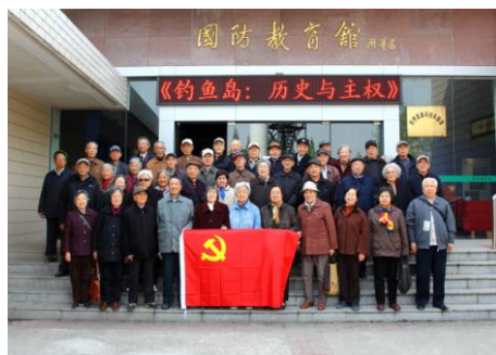
老同志在国防园合影留念

们的启示。“今天的幸福生活来之不易，若有谁胆敢破坏，我们拼着这把老骨头也不得不走上战场和他们斗一斗！”这，就是老同志们此次国防园之行发出的心声。