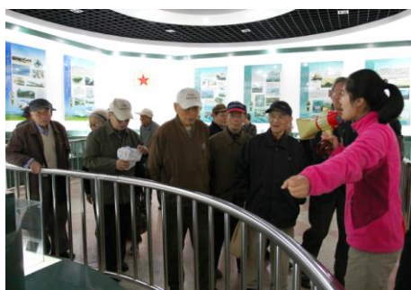
老同志参观兵械展

岛拥有无可争辩的主权的历史事实和法理依据，钓鱼岛自古以来即是中国的固有领土！展品中有一部宋元时期中国舟师根据长期航海经验积累编写，明代永乐年间（1403-1424年）中国官员根据下西洋的航海实践，累次校正古本而来的史料《顺风相送》，其“福建往琉球”一章最早记录了有关钓鱼岛及