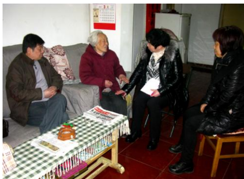
老干部处去看望老同志

今年的冬天格外寒冷，但，东南大学的离退休老同志却感觉十分温暖。春节前后，老同志们分别收到来自学校党政、原工作单位党政、相关职能部门、校学生社团等，不同形式、不同方式的慰问、祝福：有的举办新春座谈会、迎新茶话会，在畅谈学校发展、国家变化，交流健康长寿之道、