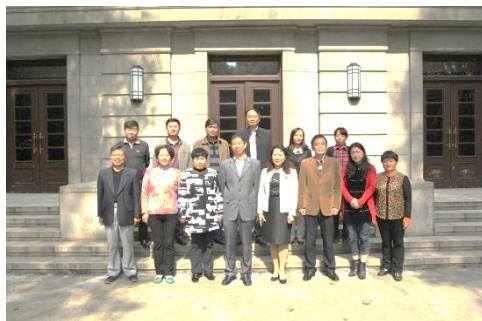
与会人员在大礼堂合影

探讨如何学习贯彻习总书记系列讲话和全国全省离退休干部“双先”表彰大会精神,开展好老干部为党的事业增添正能量以及如何多为老同志办实事、做好事。