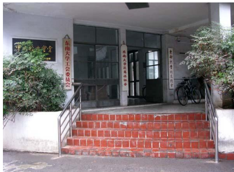
校友会堂新安装的扶手

为方便使用轮椅的老同志进出校友会堂，老干部处多年前就在后门修建了无障碍通道；工会、退休科、老干部处等大门的门槛虽然只有几厘米高，为了防止老同志绊