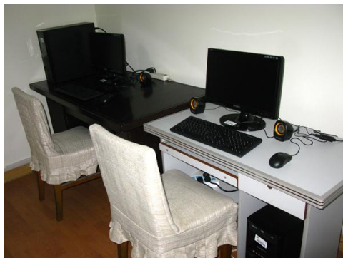
活动室新添置的两台电脑

老干部处还为这间小活动室 配置了窗帘、沙发、茶几、空调、 靠垫等，这样，无论春夏秋冬、寒 来暑往，老同志都可以在这里舒适