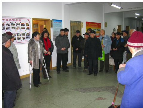
趣味运动会前先宣布比赛规则