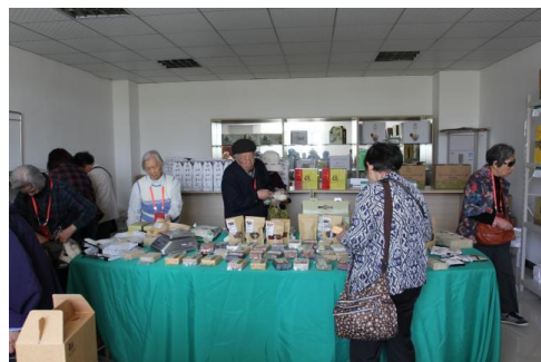
老同志在选购绿色农产品

厂、3400平米现代农业创意馆、40000平米智能温室、300亩高效设施果园）、工厂化农业生产区（食用菌工厂、乳鸽养殖工厂）和乡村旅游景区（200亩薰衣草园、4000平米生态餐厅）。目前园区已获得全国休闲农业与乡村旅游五星级示范企业（园区）、江苏省现代农业科技园、江苏省青少年科普教育基地、江苏省农机化科技示范基地、南京市农业产业化重点龙头企业、南京现代农业示范区、南京市农业科技成果转化基地等各类荣誉称号。2014年，园区全力打造青奥配套服务鲜切菜果品加工项目，已圆满完成第二届青奥会果蔬供应任务。该项目配套工程（鲜切菜加工厂）占地10亩，总投资3000万元（其中固定资产