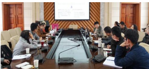
许秘书长在给青年教师讲课培训