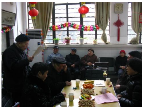
老同志在茶话会上抒发心声