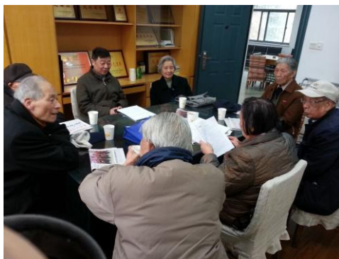
离休干部党委各党支部召开会议

近期，东南大学离休干部党委根据东大委〔2015〕18号“关于做好基层党委、党总支、直属党支部换届选举工作的通知”精神正在积极进行东南大学离休干部党委换届选举的筹备工作。根据东南大学党委布置的党委换届工作的要求，东南大学离休干部党委进行了多次会议磋商，拟定了换届工作的初步方案，于4月17日向东南大学党委副书记刘鸿健进行工作汇报：1)从老干部实际情况出发，就身体条件、道德素养以及群众威信方面提出候选人名单；2)候选人不受当选届数的限制；3)对个别同志做了个别介绍。4月18日，离休干部党委召开党委会，确定了候选人条件、人数以及召开支部书记联席会的时间和内容。4月19日始，离休干部党委各个党支部分别召开支部大会，提出候选人名单以