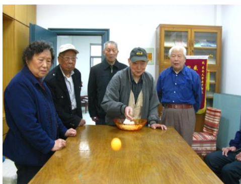
老同志在参加比赛

4月23日，老干部处在校友会堂举办了符合老同志身体条件的趣味运动会，几十名老同志兴致勃勃地参加了“投飞镖、掷沙袋、钓鱼、套圈和青蛙跳”的比赛。老同志们通过比赛增进了交流，获得了乐趣，也赛出了水平，赛出了风格。