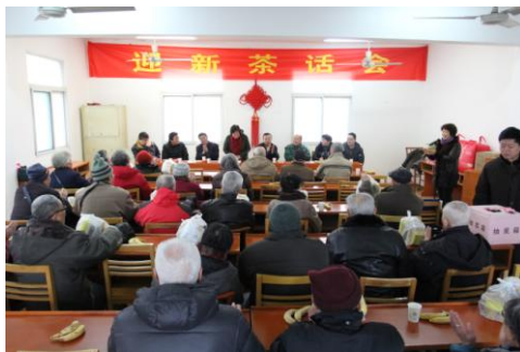
丁家桥校区离休干部迎春茶话会

2015年1月28日上午8时30分，在丁家桥校区老干部处活动中心，举办迎新春茶话会，学校党委郭广银书记，刘鸿健副书记及丁家桥校区各部门负责人出席茶话会。郭书记回顾了2014年东南大学的发展，并向老同志们通报了学校在各方面所取得的成绩，也向老同志表达了学校领导对大家的关心。老同志对学校的发展听得津津有味，对学校