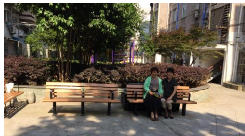
老干部处赠送给社区的休闲椅