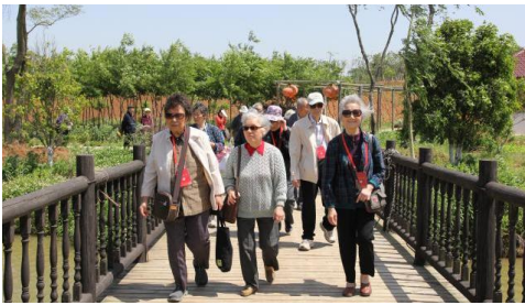
老同志在景区参观

5月12日，老干部组织老同志到汤山翠谷生态园参观考察。这一天，风力很大，天空也因此一扫往日的阴霾，变得异常清澈湛蓝。老同志们个个精神矍铄，神采飞扬，一路欢声笑语来到了江宁汤山翠谷现代农业示范园。