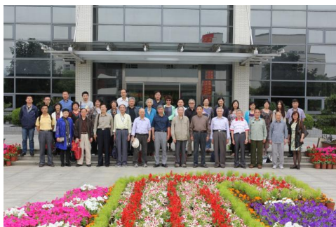
与会人员在江南大学合影

况;随后,参会人员围绕二级学院关工委工作常态化建设考核进行工作研讨,并互赠工作资料。