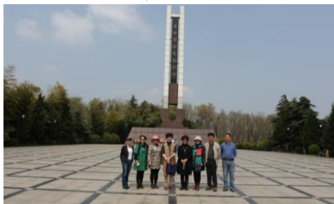
老干部处党支部在纪念碑前合影

珍惜，铭记革命历史，传承革命光荣传统，在平凡的岗位上辛勤工作，为中华民族的伟大复兴做一份贡献。