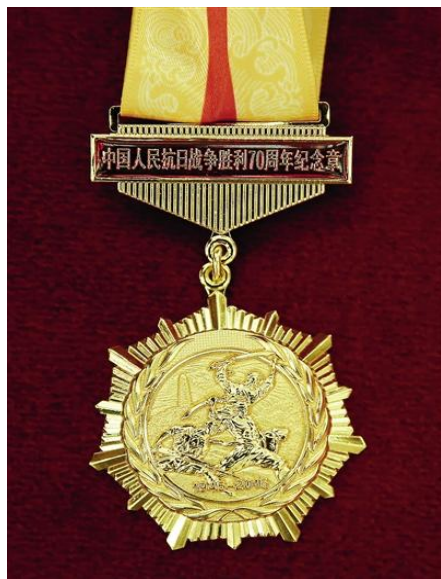
抗战胜利 70 周年纪念章图片

纪念章设计庄重大气、简洁明快，既有浓厚的历史继承性又有新时代的鲜明特征，充分体现了抗战老战士老同志和抗战将领对中国人民抗日战争和世界反法西斯战争胜利作出的历史贡献。