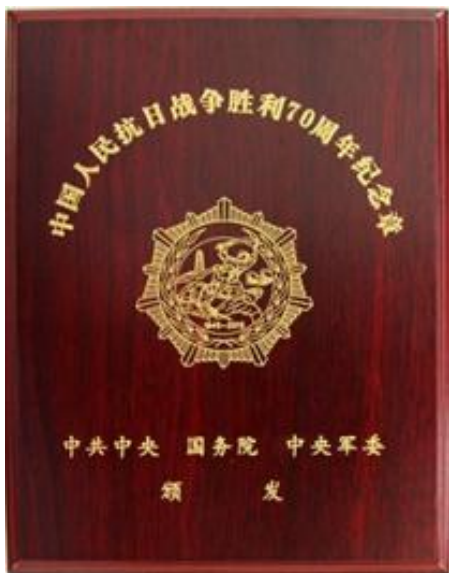
抗战胜利 70 周年纪念章图片

抗战胜利 70 周年纪念章直径 50mm、厚 3mm，采用紫铜胎体镀金。每枚纪念章配 1 个仿红木内包装盒、1 个硬纸板外包装盒、1 条绶带、1 张说明卡。纪念章围绕着“铭记历史、缅怀先烈、珍爱和平、开创未来”的主题而设计，由抗日战士浮雕、延安宝塔山、黄河、橄榄枝、光芒 5 大元素构成。