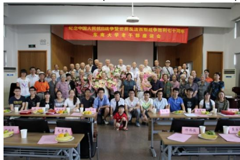
全体参会人员合影