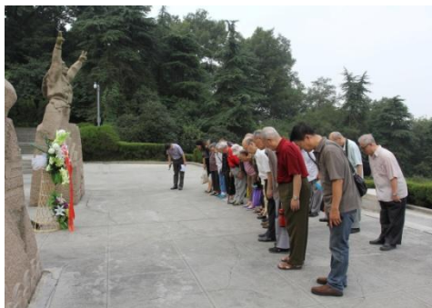
老同志向抗日航空烈士纪念碑致敬

抗击侵华日军的英勇历史。随后，老同志们来到抗日航空烈士纪念碑前，向烈士纪念碑敬献了花圈，并默哀致敬。