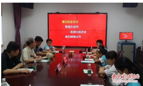
红领巾寻访活动现场

为了纪念抗战胜利 70 周年，关心下一代成长，日前，东南大学关工委联合北京东路小学五（2）中队“黑鹰小队”开展了“纪念抗战胜利 70 周年”红领巾寻访活动。