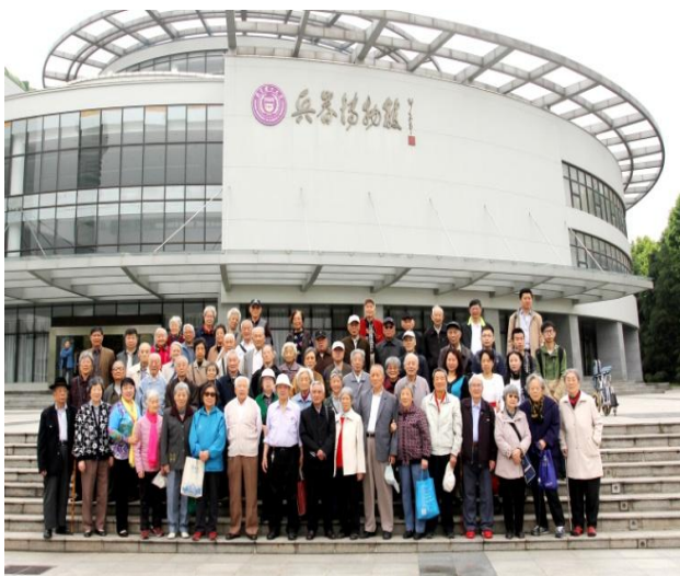
老同志在兵器博物馆合影

随后，老同志又来到东南大学九龙湖校区，参观了建筑面积为2.27万平方米的现代化体育馆。