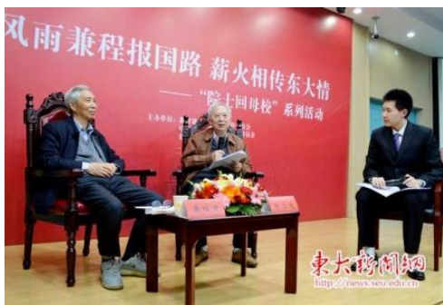
两位院士在接受采访

4月28日，著名通信技术专家、中国工程院院士张乃通校友，著名雷达目标特性专家、中国工程院院士黄培康校友应邀来到东南大学九龙湖校区参加“院士回母校”东南大学站活动，与母校师生亲切交流。此项活动由教育部关工委、中国工程院科学道德建设委员会、东南大学等单位联合主办，校团委和信息科学与工程学院等单位承办，东南大学关工委协办。教育部关工委常务副主任、原国家副总督学杨贵仁，教育部离退休干部局副局长、教育部关工委副秘书长于虹，中国工程院二局副巡视员王元晶，东南大学党委副书记兼副校长刘波及团委、党委老干部处、档案馆、信息科学与工程学院负责同志，院系关工委副主任以及各院系师生代表400余人参加了活动。活动开始前，东南大学郑家茂副校长亲切会见了两位院士校友。两位院士还在信息科学与工程学院负责同志的陪同下，来到南京江宁“无线谷”参观，并与学院师生进行了座谈交流。