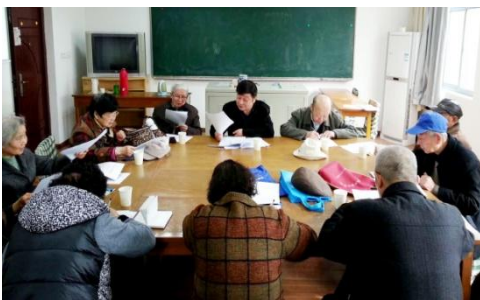
离休干部党委扩大会议