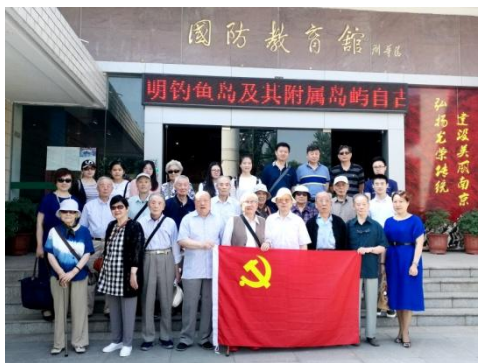
党员同志在国防园

图片展出 550 余幅图片，4 万余文字，按照时间顺序，系统地展现了从 1919 年到 2015 年中国共产党领导南京人民进行革命、建设、改革开放和率先基本实现现代化的光辉历程。展厅讲解员结合图片资料为大家讲述了马克思主义传播与中共南京地方组织建立、大革命的洪流与逆境中的曲折斗争、新生政权的巩固与社会主义社会制度的建立等 13 个部分的内容，其中包括王荷波与南京第一个党小组的诞生、从 1927 年“四一二”反革命政变到 1934 年间南京中共党组织先后遭到的八次大破坏等珍贵的历史图片和史料。