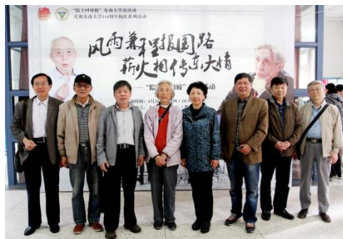
关工委老同志们海报前合影

杨贵仁常务副主任在致辞中说，为了深入贯彻落实习近平总书记重要指示，学习院士事迹、弘扬院士精神、发挥院