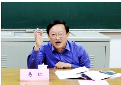
易红书记向老同志征求意见

5月30日，在老干部处会议室举办了中共东南大学第十四次代表大会党委工作报告（征求意见稿）和纪委工作报告（征求意见稿）意见征求座谈会。东